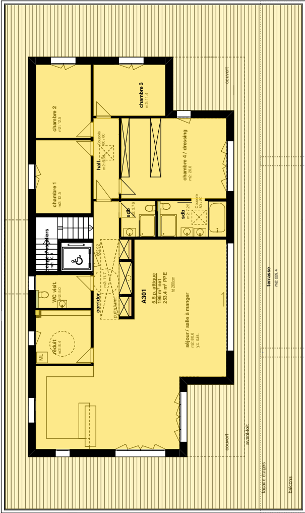
Plan de l'attique (A301) sur la terrasse (02.10.6)